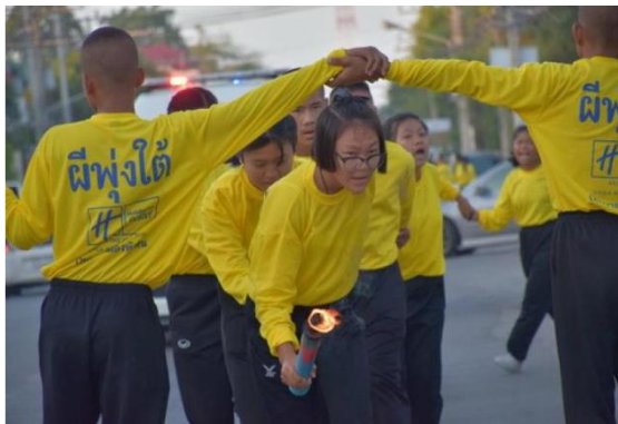
รูปภาพแสดงกิจกรรมการเล่นผีฟุ้งได้