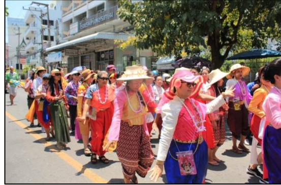
การจัดขบวนแห่มาสงกรานต์