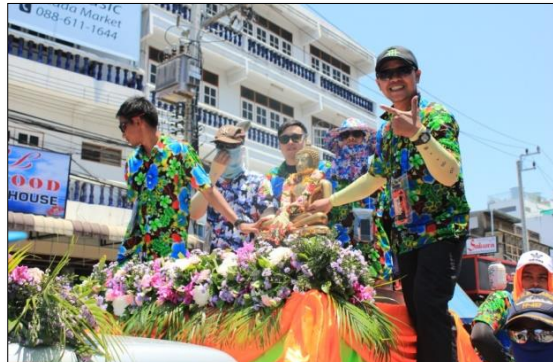
ขบวนแห่พระพุทธรูปและขบวนแห่หลวงพ่อกษัตริย์ซึ่งเป็นเจ้าอาวาสวัดหัวหินรูปแรกที่ชาวหัวหินและคนทั่วไปให้ความศรัทธาเลื่อมใสเป็นอย่างมาก