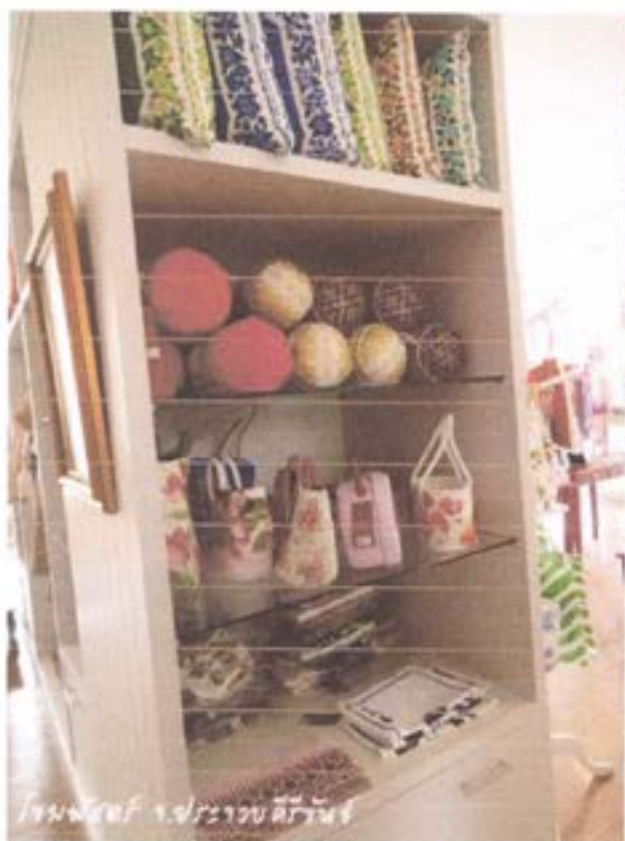
โถงผ้าสวย ๆ ของร้านผ้าไหม