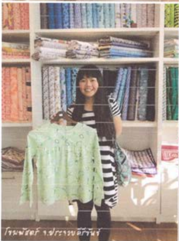
โถงผ้าสวย ๆ ของร้านผ้าไหม